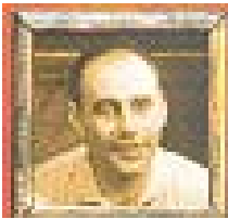
Jurat núm. 1.

El president. Preocupat per mantenir l'ordre i seguir els procediments formals, un xic rígid i poc acomodaticí. Quan algú se li oposa, respon fent el bot com un infant. No té dots de líder i és molt sensible a la crítica.