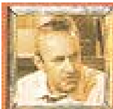
Jurat núm. 3

Sorollós i cridaner, intolerant, groller, home que s'ha forjat a si mateix, barroer i simple. La seva frase és "Jo n'estic segur". "Crec que és culpable (...) no em mouen motius personals". Ha pujat un negoci de missatgeria i té molts empleats al seu servei però ha estat incapaç de retenir el seu fill. Ressentit contra tots els joves per la pèrdua del propi fill, no res més que un pobre frustrat que potencia la seva còlera contra els altres. Desafiant fins al final.