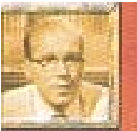
Jurat núm. 2

El president. Preocupat per mantenir l'ordre i seguir els procediments formals, un xic rígid i poc acomodaticí. Quan algú se li oposa, respon fent el bot com un infant. No té dots de líder i és molt sensible a la crítica.