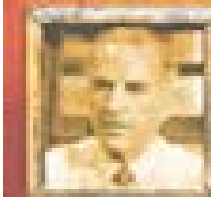
Jurat núm. 10

Amo d'un garaig, està més pel negoci que per fer de jurat. Està amargat, és reaccionari, intolerant, racista, parlant sempre d' ells (la púrria, els barris baixos, els degenerats, etc..) i nosaltres els bons, els superiors. Però sol no és ningú. "Si no creu al xicot perquè creu a la dona que és de la mateixa 'calanya'", li retopa Fonda en un moment donat.