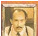
Jurat núm. 11

Amo d'un garaig, està més pel negoci que per fer de jurat. Està amargat, és reaccionari, intolerant, racista, parlant sempre d' ells (la púrria, els barris baixos, els degenerats, etc..) i nosaltres els bons, els superiors. Però sol no és ningú. "Si no creu al xicot perquè creu a la dona que és de la mateixa 'calanya'", li retopa Fonda en un moment donat.