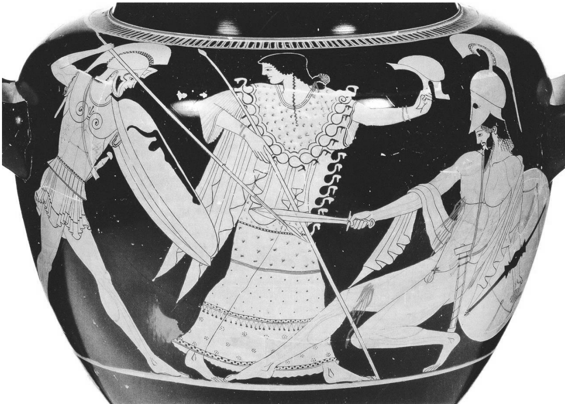
Aquiles en combate con Héctor, en el centro Atenea